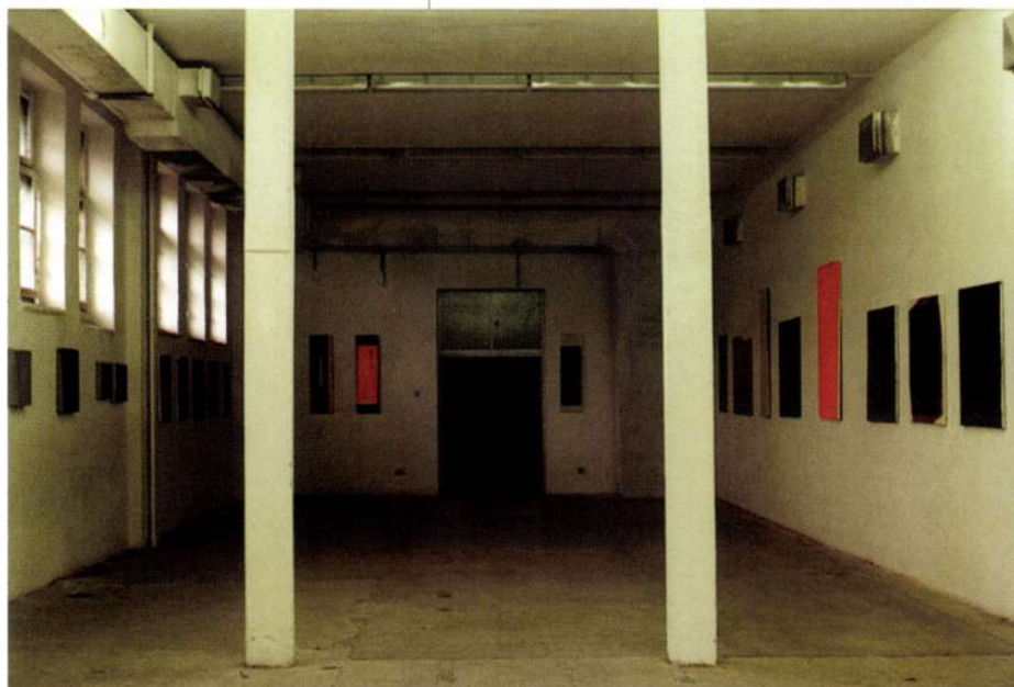
Kiállítás enteriőr